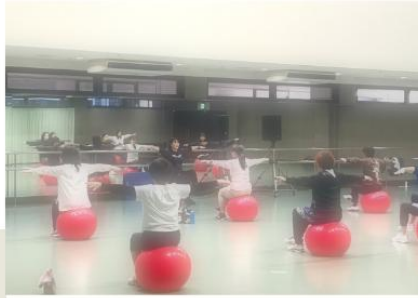
フィットネス体験

バランスボールを中心にリズムに合わせた有酸素運動を行います。全身の筋肉を使うことで血流を良くし、肩こりや腰痛の解消に繋がります。