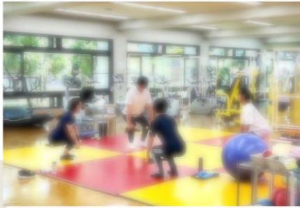
ダイエットプログラム体験

ダイエットに効果的なトレーニングの仕方をご紹介します。自重でできるトレーニングやマシンを使ったトレーニングプログラムなど毎月違ったプログラムを企画しております。